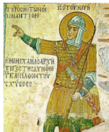
Иисус Навин (фреска X века, монастырь Оснос Лукас)

Непосредственно после смерти Моисея к Иисусу явился Бог и сказал ему: